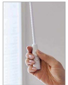
ポールスイッチ操作