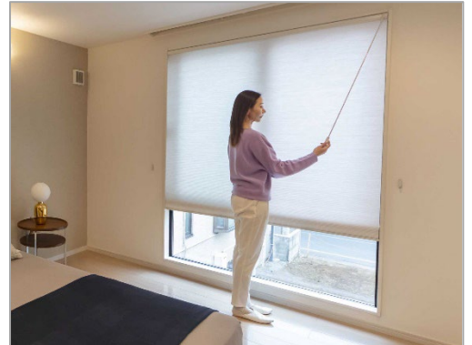
eタッチ ウィンドウタイプ

今回「eタッチ ウィンドウタイプ」の発売にあわせ、ダブルハニカム生地・アルミレールの新色追加・入替え等の仕様改善も行い、更に使い勝手のよい窓辺の断熱・省エネアイテムに進化いたします。